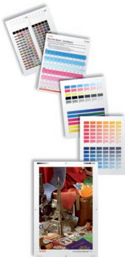
Las herramientas incorporadas de calibración del color le brindan el resultado final que usted desea.

Es por esta razón que la impresora color Xerox Phaser 7760 es la elección de los diseñadores. Ofrece colores brillantes, velocidades impresionantes y funciones fáciles de usar para que pueda sacarle el mayor provecho a todo lo que imprima.